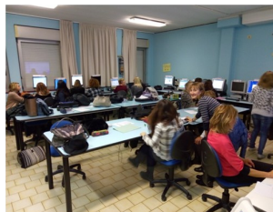
Corso di formazione

Premessa: Molti docenti della nostra istituzione hanno partecipato attivamente al Piano Nazionale Scuola Digitale. Alcuni sono diventati Figure di Sistema del Circolo e altri hanno partecipato alla Formazione dell'Ambito 21 sulle Piattaforme o alla Formazione del Servizio Marconi di Bologna.